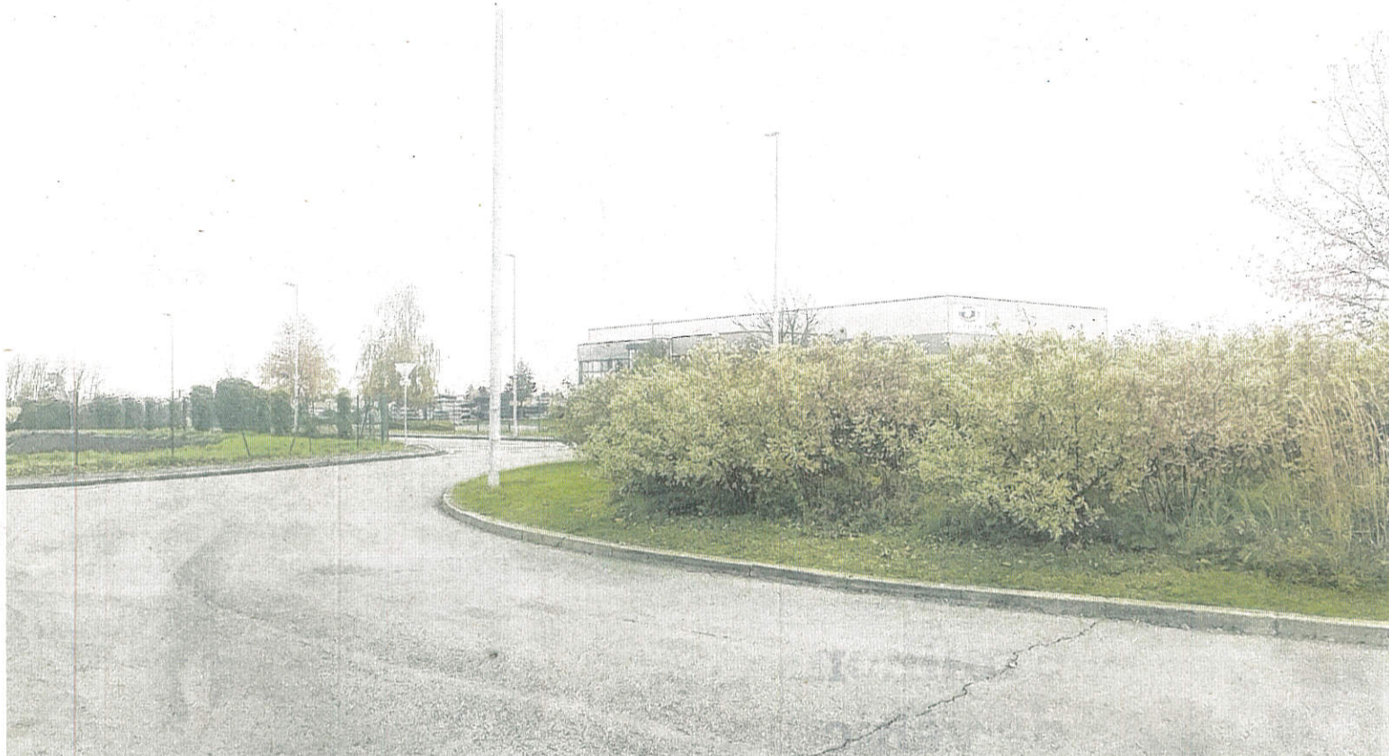
Le dernier rond-point de la zone Unexpo mène actuellement à deux cul-de-sac...

La bretelle de sortie, entre Templemars et Seclin, permet d'arriver au dernier rond-point au bout de la zone Unexpo. Un em-